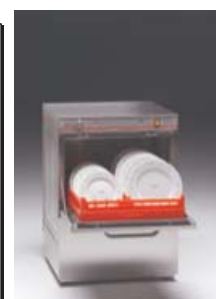
Lavavajillas industrial FI-30 original